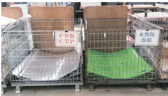
▲富士フィルムの版(左側)を分別する